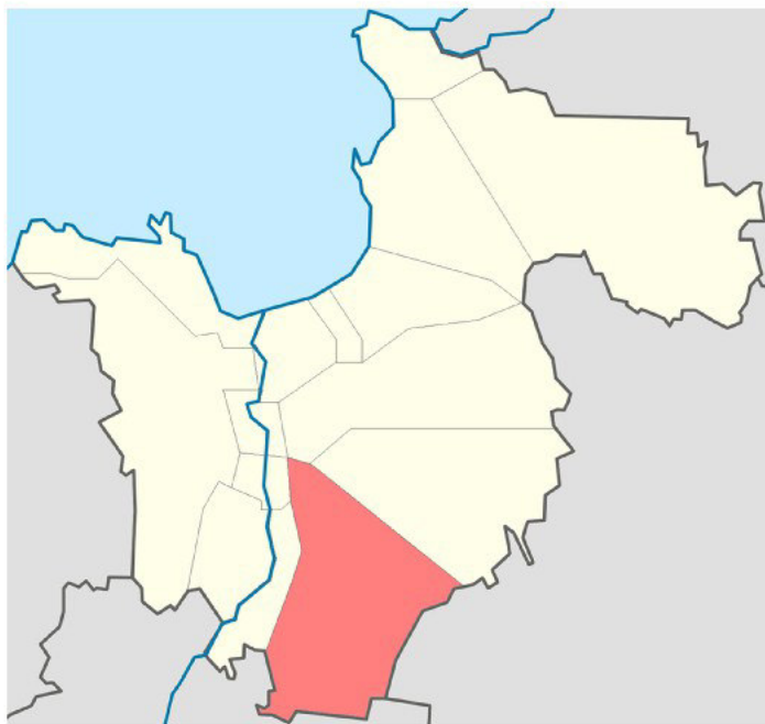
Рисунок 1.1 – Территориальное расположение МО Ушадищенское сельское поселение