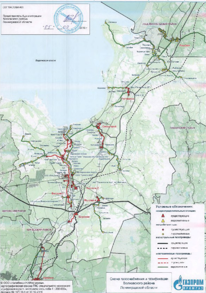
Схема газоснабжения и газификации Волховского района (2018 г.)

Взам. инв. № Лист № подл. Подпись и дата Изм. Кол.уч. Лист № док. Подпись Дата